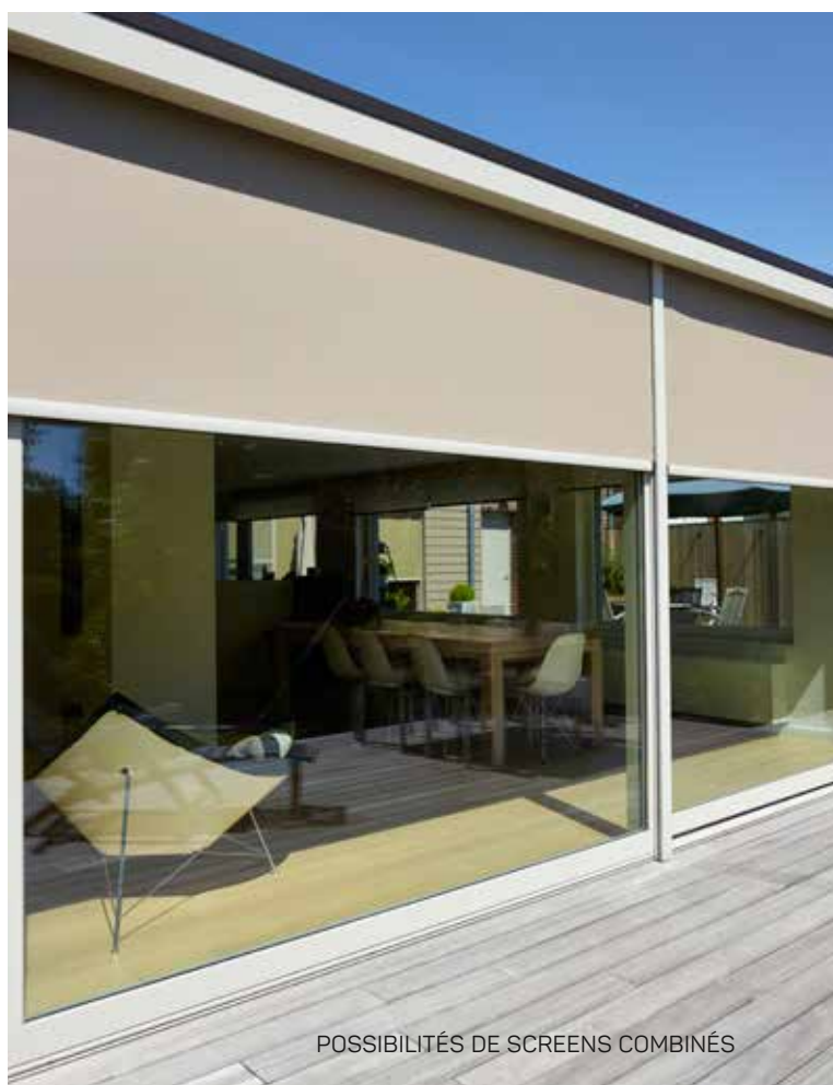
POSSIBILITÉS DE SCREENS COMBINÉS